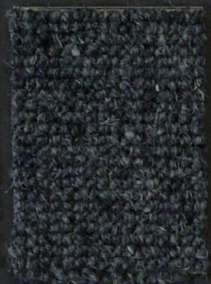
Tube c 289