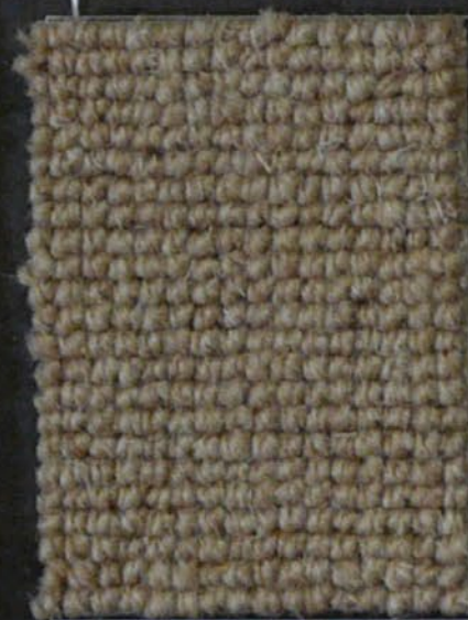
Tube c 42