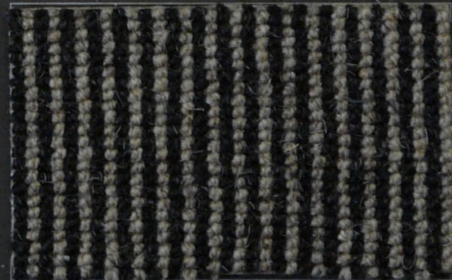
Tube m 49