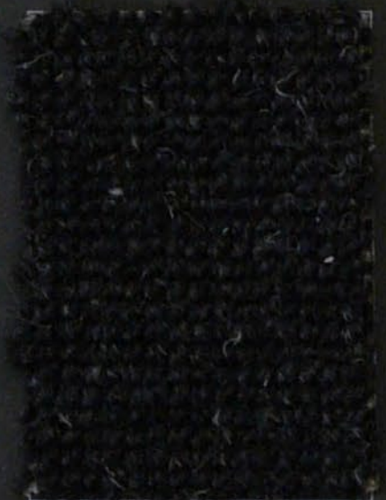
Tube c 48