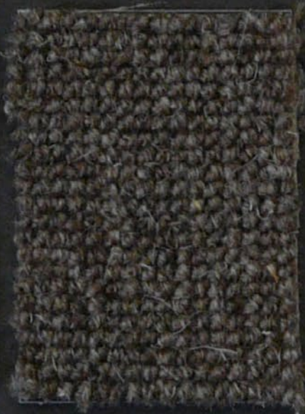
Tube c 33