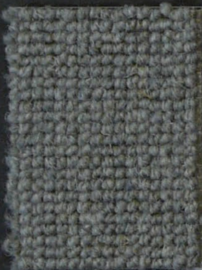
Tube c 24