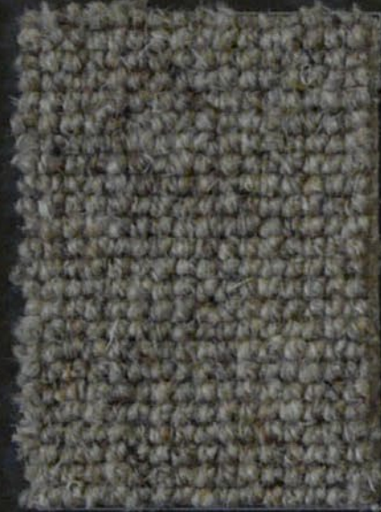
Tube c 36