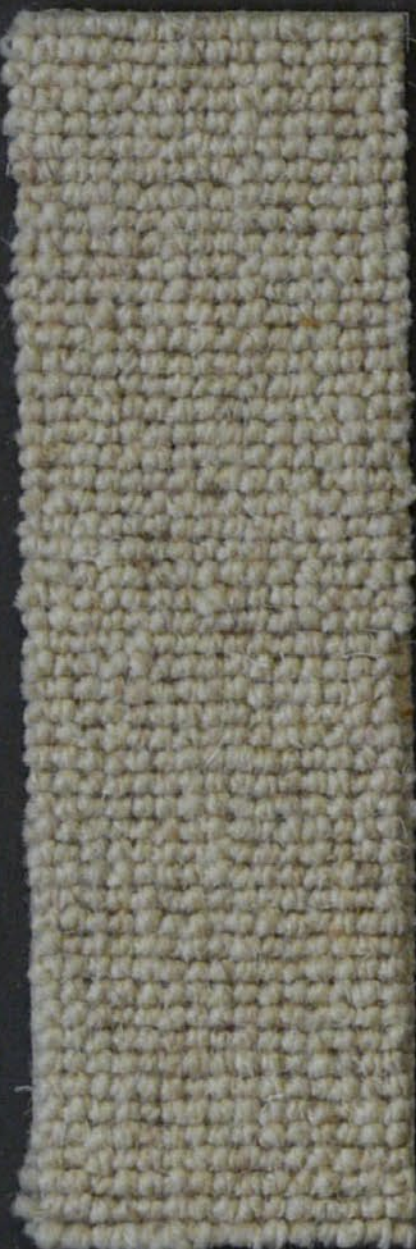
Tube c 21